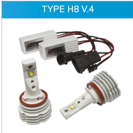
TYPE H8 V.4

Die drei H8 Kits für BMW Angel Eyes sind ab sofort in der vierten Version verfügbar. Der Strahlwinkel ist verstellbar und die Lichtleistung ist zu 50% stärker als jene der Vorgängerversion.