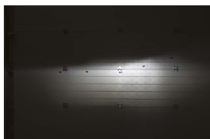
Kit D-LH4 Feux de croisement : 826 Lux Abblendlicht : 826 Lux

Lichtleistungsvergleich zwischen einer Osram Classic H4 und einem neuen DSM Lights LED Umrüst-Set (Hella 1A3 996 002-161 Scheinwerfer, Messdistanz 8 Meter).