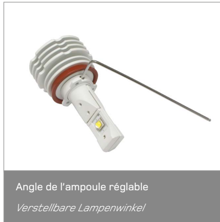
Angle de l'ampoule réglable Verstellbare Lampenwinkel